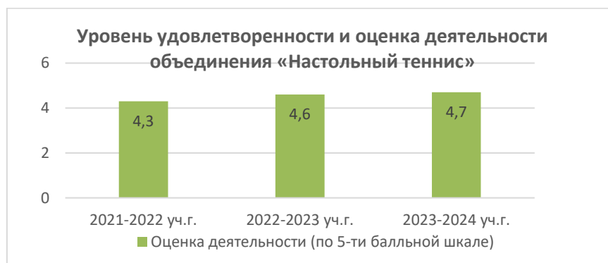
Рисунок 2. Уровень удовлетворенности и оценка деятельности объединения «Настольный теннис»

Высокий интерес к занятиям обеспечивается за счет высокого объема практических занятий и регулярного проведения соревновательных занятий (учебные игры, внутренние турниры) (Рисунок 1).